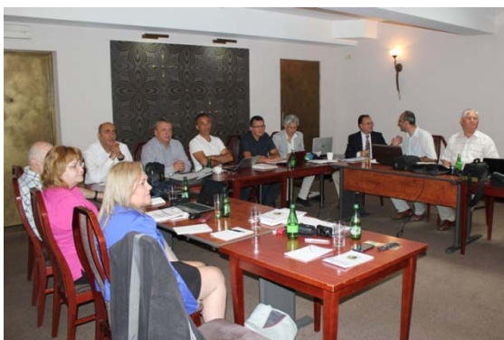
2. értekezlet: Krakó (Lengyelország)

Az AGRI-YOUTH projekt célja: ezen meglévő tananyagok frissítése, átdolgozása, külön hangsúlyt fektetve a fiatal és női vállalkozók igényeire, egyúttal hídverés kíván lenni a legjobb európai gyakorlatok és a magyar adottságok között.