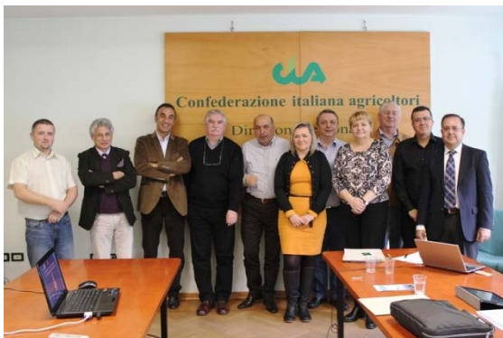
A projekt nyitóértekezlete (Perugia, Olaszország)

Az AGRI-YOUTH projekt célja: ezen meglévő tananyagok frissítése, átdolgozása, külön hangsúlyt fektetve a fiatal és női vállalkozók igényeire, egyúttal hídverés kíván lenni a legjobb európai gyakorlatok és a magyar adottságok között.